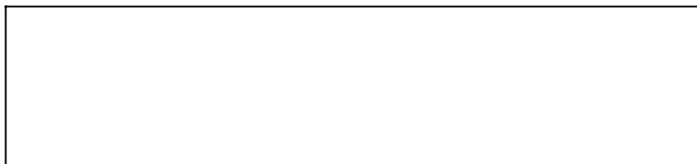
Figura 1: Relațiile dintre elementele ce determină devianța secundară.

Sursa: George C. Basiliade, Criminologie comprehensivă , Editura Expert, București, 2006, p. 426.